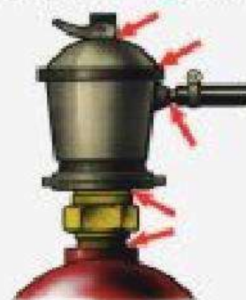
Красные стрелки указывают места проверки обмыливанием после включения газа