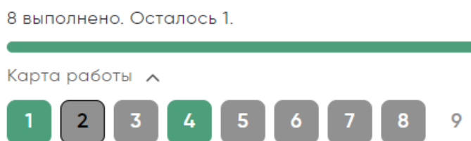
Рисунок 4. Карта работы

Если участник пропустил какой-то вопрос и хочет к нему вернуться, можно нажать кнопку «Назад» или выбрать номер пропущенного вопроса в карте работы.